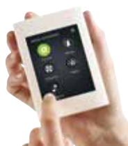
Интерфейс Enervent eAir + web

Максимальный расход воздуха ПВУ Enervent SVEA, несмотря на ее компактные габариты, составляет почти 600\text{ м}^3/\text{ч} . Такого уровня производительности вполне достаточно для жилого здания площадью около 200\text{ м}^2 . Установка комплектуется высокопроизводительным роторным рекуператором, благодаря которому годовая эффективность восстановления тепла составляет 85%. Enervent SVEA не просто имеет компактные габариты - мы пошли еще дальше и сделали ее дизайн модульным. При необходимости над ПВУ можно разместить дополнительный модуль - это может быть испаритель СХ, контур водяного нагрева или охлаждения. При этом увеличивается только высота общей конструкции. Также предусмотрена возможность модернизации ранее установленных модулей. Enervent SVEA оснащена подключением для кухонного вытяжного зонта (также поставляется в виде дополнительного модуля). Вытяжной воздух от кухонного зонта минует рекуператор и подается напрямую к вытяжному вентилятору ПВУ. Подобное решение позволяет предотвратить загрязнение рекуператора.